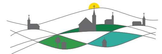
MAŠNI NAMENI ŽUPNIJE PRESKA