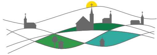
MAŠNI NAMENI ŽUPNIJE PRESKA